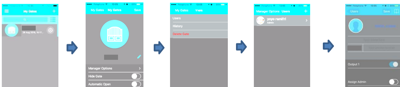
Нажать на кнопку «Настройки» (шестеренка)